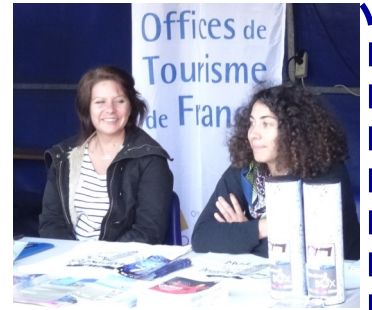
L'office du tourisme.