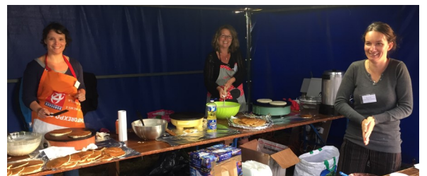
Au stand kouigns, les crêpières de l'APE ont préparé 48 kg de pâte durant les festivités.