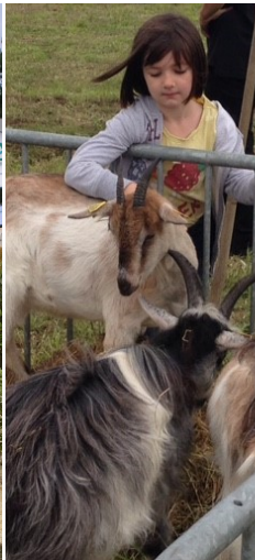
Tu es béeèèlle !