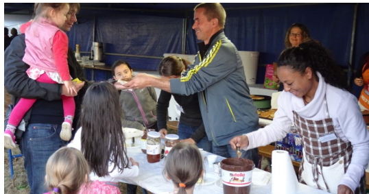
Enorme succès des kouigns et des frites!