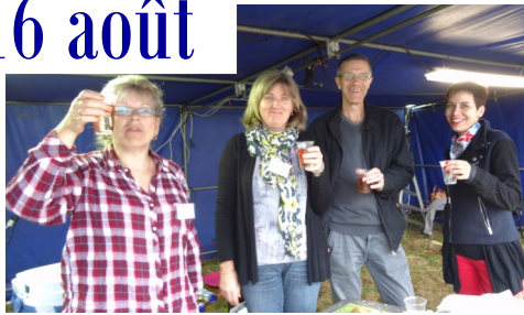
Les bénévoles, les associations trolimonaises et l'équipe municipale ont répondu présents et se sont donnés à fond tout au long de ces 3 jours de fête.