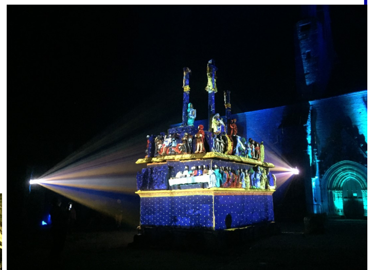
À 22h30 la mise en lumière du calvaire de Tronoën a été le moment fort de la soirée. Un spectacle émouvant, impressionnant... Magique !