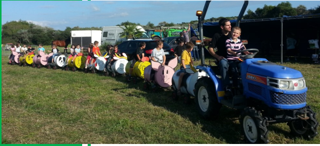
Le petit train cochon des enfants.