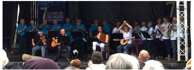
Les voix de la mer avec un beau récital de chants de marins.