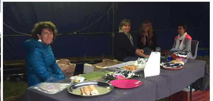
... et les sourires au stand « bénévoles ».