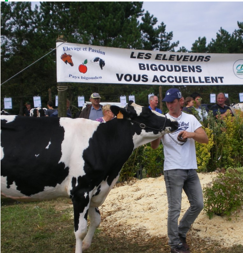
Défilé devant le jury.