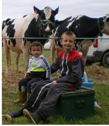
On va voir les vaches ?