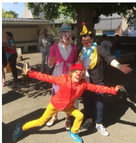
Dans la cour, les jeux traditionnels ont connu un beau succès. Et, tout au long de l'après-midi, les clowns ont semé leur grain de folie et ravi le public.