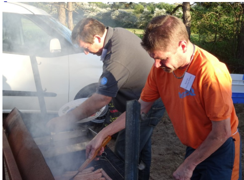
La préparation des saucisses par le club de foot.