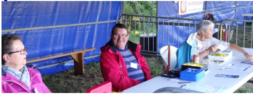
La caisse pour échanger l'argent en tickets « troll ».