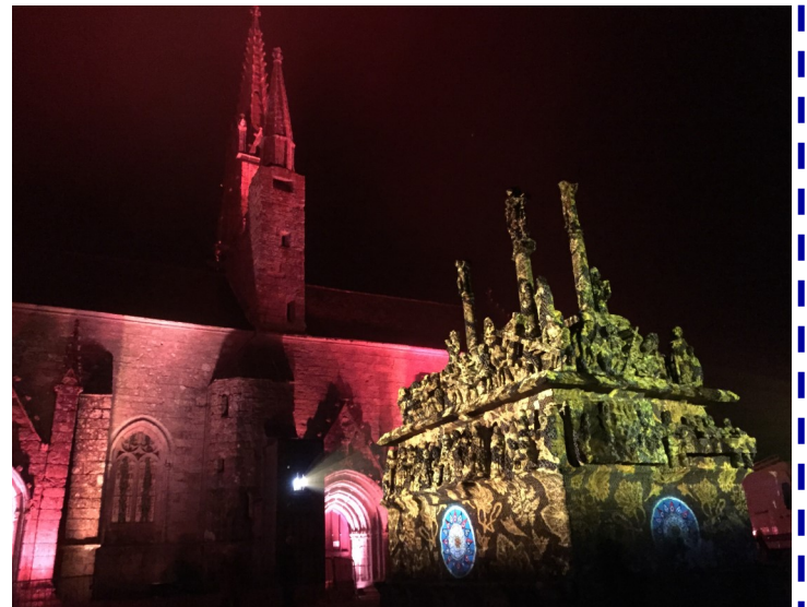
Les bigoudènes ont fait forte impression sur le site. Ensuite le concert du troubadour Melaine Favennec a ravi les spectateurs, qui ont découvert en fin de soirée le magnifique calvaire de Tronoën paré de mille couleurs chatoyantes... Inoubliable!