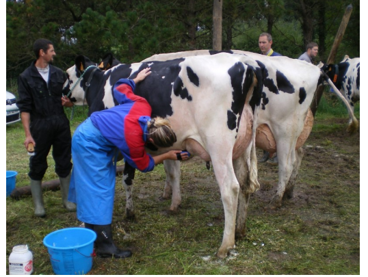
Mise en beauté avant le concours.