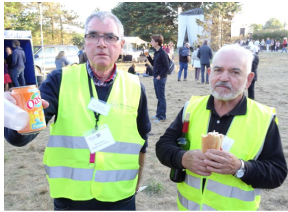
Les bénévoles parkings /circulation.