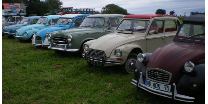
... et de vieilles voitures.