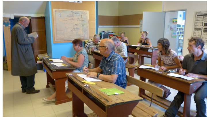
La classe à l'ancienne, avec une dictée rédigée à la plume Sergent Major.