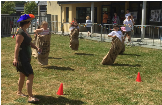
La course en sac... Fous rires garantis!