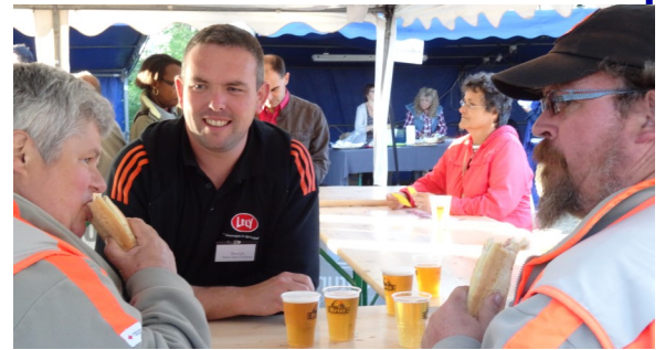
Les sourires à la buvette...