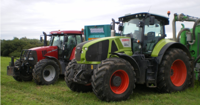
Exposition de matériel agricole...