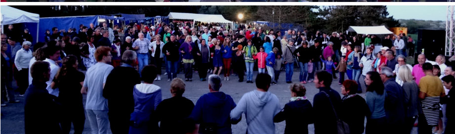
Foule des grands soirs sur le parking de Tronoën pour le fest-noz avant la colorisation tant attendue du calvaire.