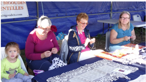
Patience et dextérité au stand de l'institut bigouden des dentelles.