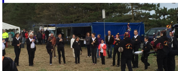
1er spectacle : Le bagad Ar Vro Vigoudenn Uhel.