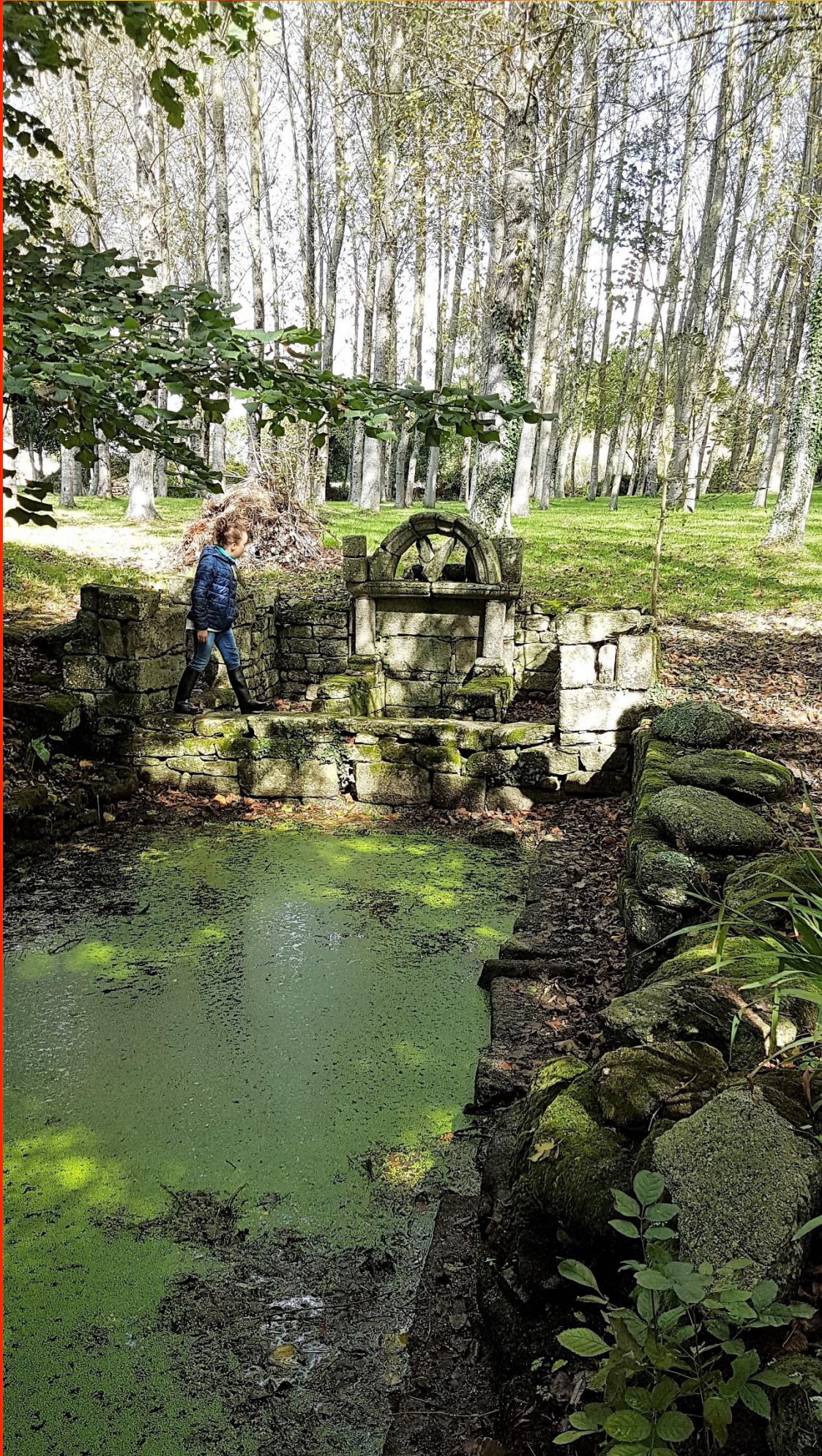
Fontaine de Kerfilin