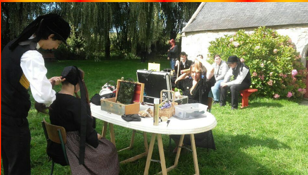
Pose de coiffe bigoudène à la chapelle de Saint Evy