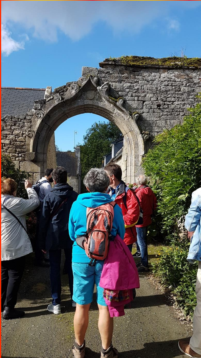
Porche du manoir de Kerfilin