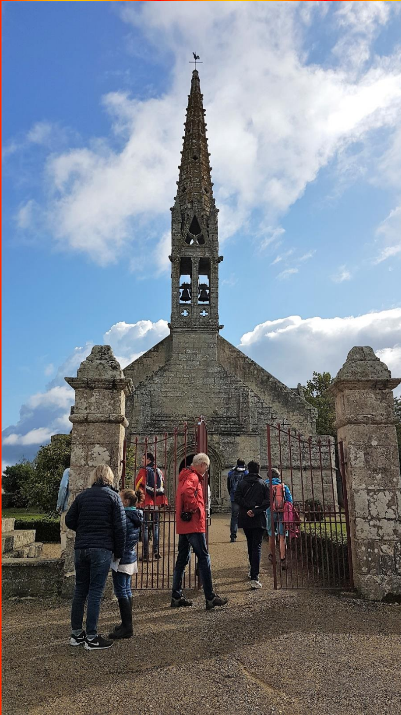
Eglise Saint Jean Baptiste