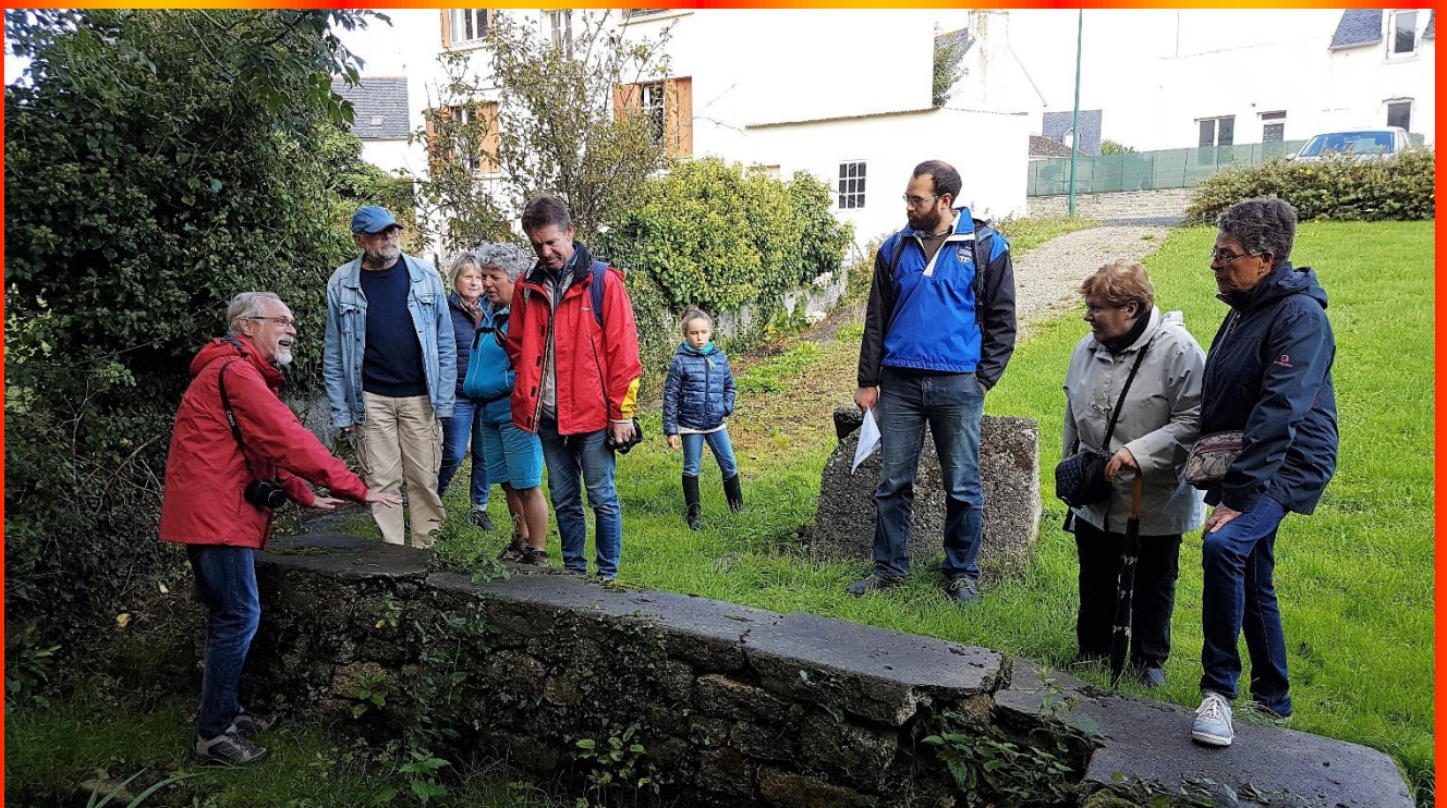
Lavoir de la rue de Tronoën